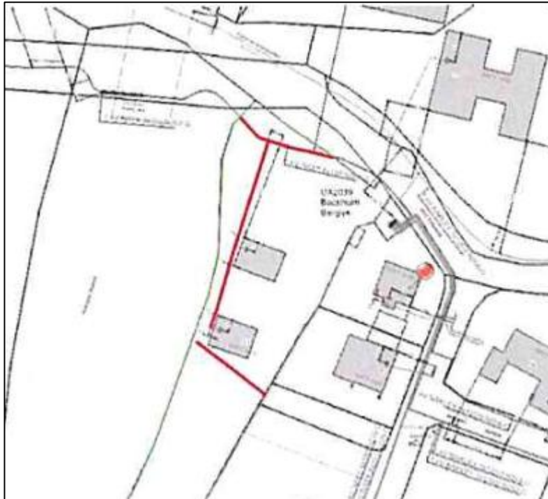
Abbildung 1 ungefähre Lage der Leitungen im Plangebiet

Insgesamt ist ein Schutzstreifen mit einer Gesamtbreite von 2,0 m, gemessen jeweils von dem Mittelpunkt der Achse der Versorgungsleitung, zu beachten.